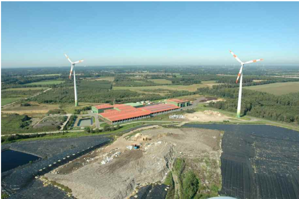
Abbildung 3 MBA Wilsum

Das auf dem Deponiefläche abgeladene Deponat wird derzeit mit einem Kompaktor auf der Deponieoberflächlich verteilt und eingebaut. Die eigentliche Verdichtung erfolgt anschließend mit einem Glattmantelwalzenzug. Die Anforderung gemäß Anhang 3 der Ablagerungs-VO werden durch diese Vorgehensweise sicher eingehalten.