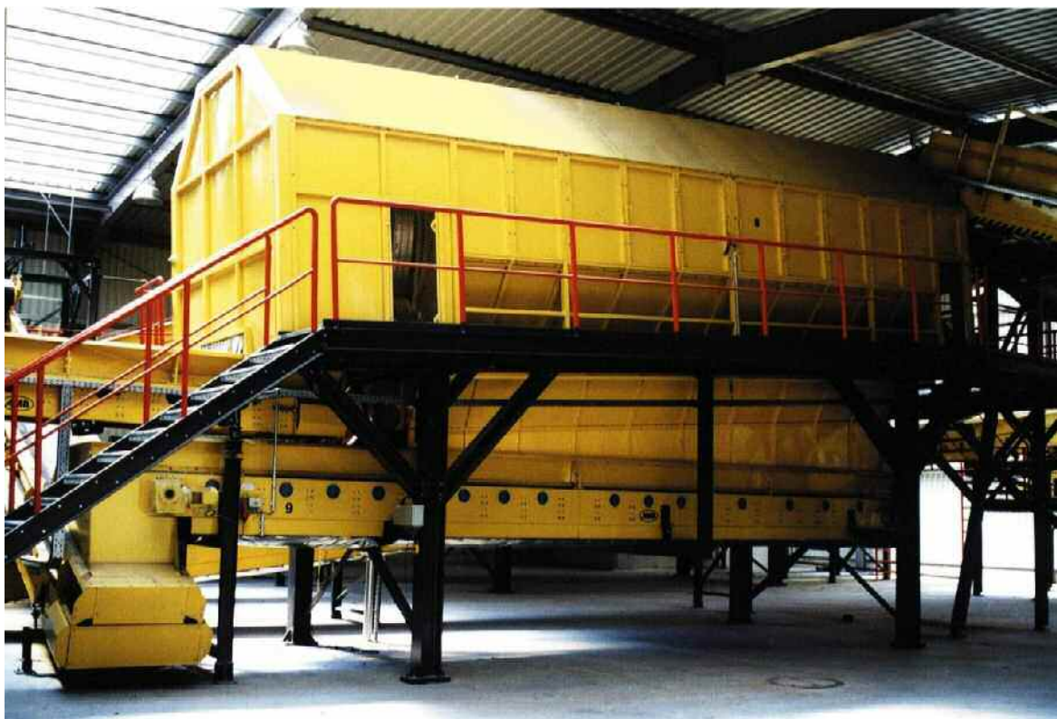
Abbildung 2 Siebtrommel

fert und die Aufbereitung des Abfalls erfolgt zeitnah. Der Flachbunker wurde im Jahre 1999 auf eine Jahresmenge von 35.000 Mg ausgelegt und stellt sich aus heutiger Sicht als sehr beengt dar. Insbesondere das Entladen der Sattelzüge aus Leer ist problematisch, da zwischen 07.00 Uhr und 17.15 Uhr die Sattelzüge gleichzeitig anliefern. Der Zerkleinerer begrenzt, neben dem Trommelsieb, den Durchsatz, seine Aufgabe ist es inerte Bestandteile (z.B. Glasflaschen) zu zerkleinern und rottefähiges Material mechanisch aufzuschließen. Gelegentlich kommt es zu kleineren Schäden oder Störungen und damit zu Stillständen, aber im Großen und Ganzen arbeitet das Gerät seit 7 Jahren mit 8.500 Betriebsstunden zufrieden stellend. Die elektrische Anschlussleistung für den Zerkleinerer beträgt 200 KW. Das Trommelsieb ist wie der Zerkleinerer auf eine Durchsatzleistung von 35.000 Jahrestonnen im Ein-Schichtbetrieb ausgelegt. Deshalb ist auch hier eine höhere Durchsatzleistung nur durch einen Zweischichtbetrieb möglich. Die für eine Klärschlammbeimischung vorgesehene Homogenisierungstrommel wird derzeit im praktischen Betrieb umfahren. Eine Einstellung des Wassergehaltes des Rottematerials ist derzeit nicht erforderlich.