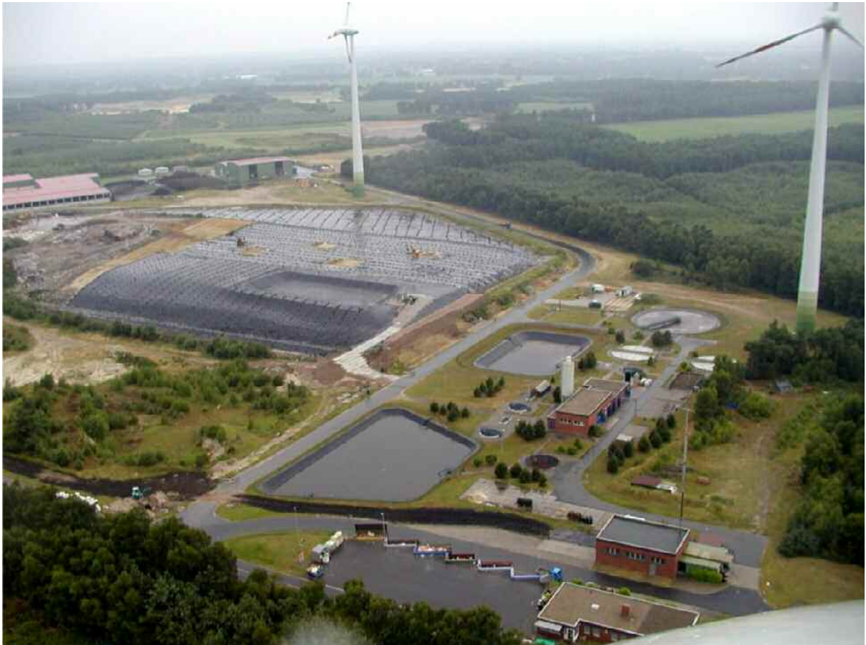
Abbildung 1 Entsorgungszentrum Wilsum aus der Vogelperspektive

Die MBA-Anlage, Gartenabfallkompostplatz, Umladeflächen, Eingangsbereich, Sickerwasserbehandlungsanlage, die zwischenabgedeckte Ablagerungsfläche und der Einbaubereich sind auf dem Foto zu erkennen. In der Nachbarschaft befinden sich Sandabbauflächen z.T. mit Wasser, Wald und Landwirtschaft.