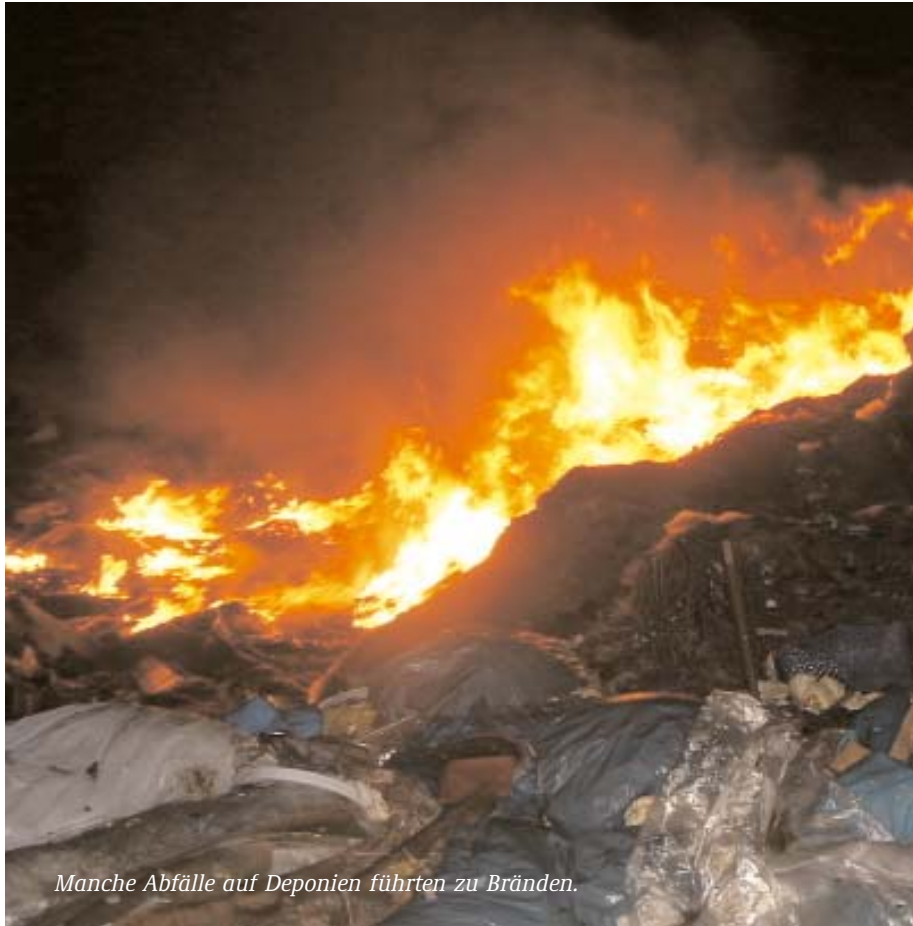
Manche Abfälle auf Deponien führten zu Bränden.

Mit dem Wohlstand kamen die Schadstoffe. Seit den fünfziger Jahren landeten auf den Müllkippen die Überbleibsel des Wirtschaftswunders: Batterien und Leuchtstoffröhren, Farbeimer und Reste von Pflanzenschutzmitteln. In der Grauen Tonne mischte sich der Wohlstandsmüll mit den Koch- und Essensresten aus der Küche, dem Laub und dem frisch gemähten Gras aus dem Garten. Die Mülltonnen wurden immer größer, die Müllabfuhr kam immer öfter und kippte das Gemisch auf einen großen Berg vor der Stadt: Es gärte, es faulte, es wurde heiß durch die chemischen Reaktionen in dem Müllgemisch. Zudem lösten sich die Schadstoffe in den Abfällen der modernen Haushalte im faulenden Biomüll. In den achtziger Jahren erkannte man dann, dass das nicht gesund sein kann. Wann immer es regnete, konnten Schadstoffe von den alten Müllkippen ins Grundwasser sickern. Nach oben stiegen Faulgase auf. Das stank nicht nur, denn die Faulgase bestehen zu zwei Dritteln aus Methan. Heute ist bekannt, dass