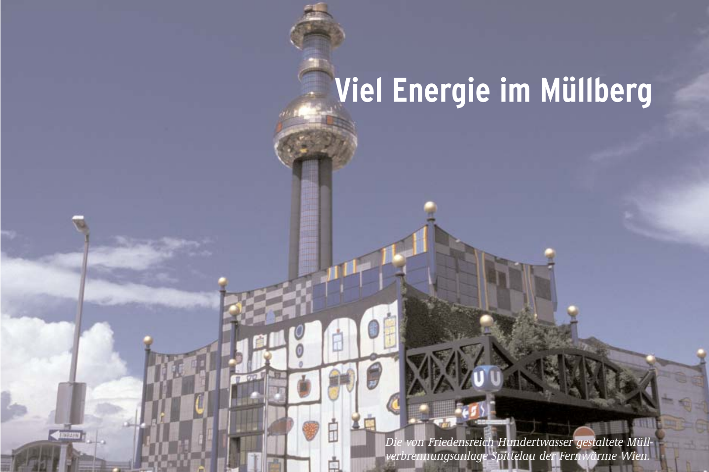
Die von Friedensreich Hundertwasser gestaltete Müllverbrennungsanlage Spittelau der Fernwärme Wien.

Vermeidung und Verwertung zuerst. Aber was macht man mit Staubsaugerbeuteln und gebrauchten Windeln? Beim Blick in die Graue Tonne wird klar: Nicht alle Bürger trennen ihren Müll, nicht jeder Müll lässt sich vermeiden. Die Abfallbehandlung soll die Schadstoffe in dem unvermeidlichen Restmüll fixieren oder zerstören.